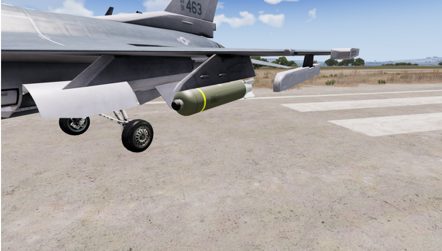
CBU-105 SFW WCMD