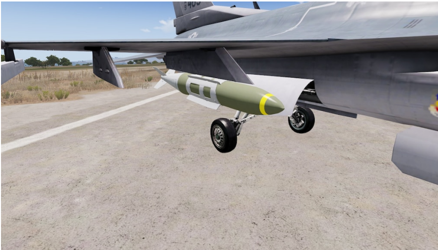
GBU-31 JDAM w/BLU-109