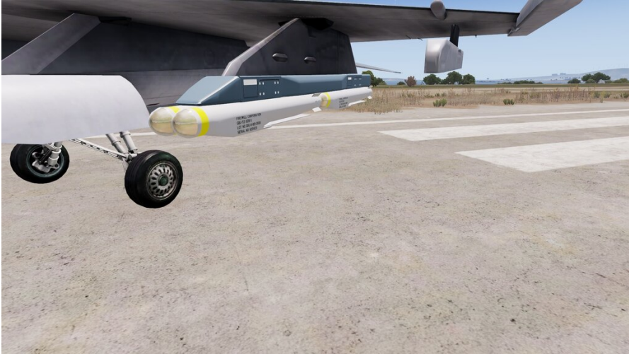
GBU-53 SDB II