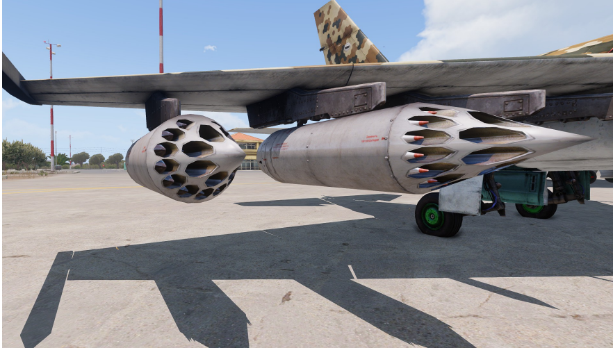
Russischer S-8 Waffenbehälter