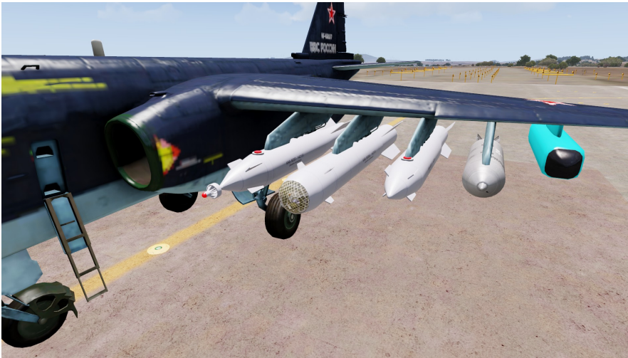
Auswahl russischer Bomben (von links nach rechts) KAB-500L, KAB-500Kr, KAB-500SE, RBK-500 SPBE-D