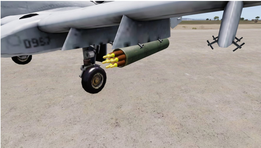
Hydra 70mm Waffenbehälter