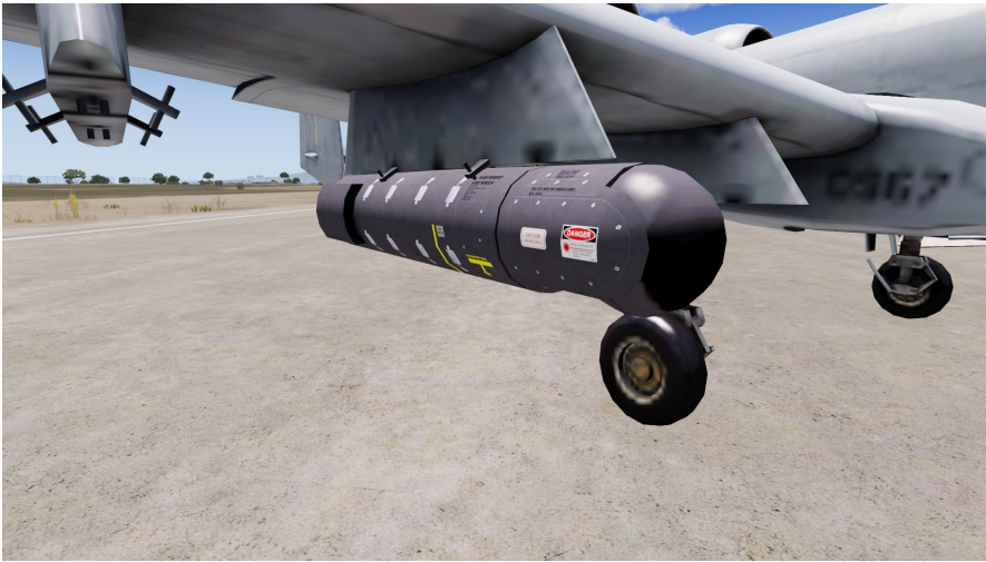
Sniper XR Targeter Pod