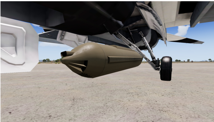
GAU-13/A 30mm Gunpod

Für den Fall das weiter oder schwerere Kanonen benötigt werden.