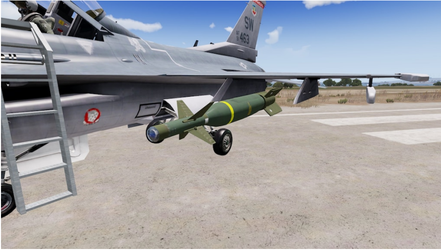
GBU-24A/B Paveway III w/BLU-109