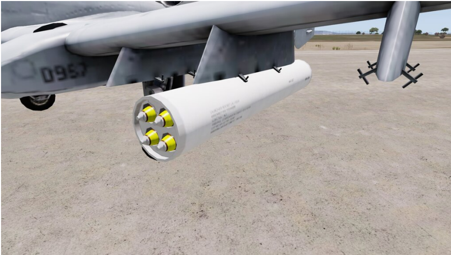
Zuni 127mm Waffenbehälter

Waffenbehälter können mit Aufhängungen für 1 oder 2 Waffenbehälter verfügbar sein.