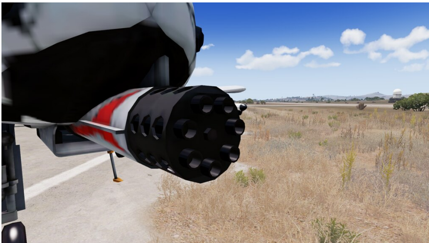
(Die Gau-8 30mm Maschinenkanone einer A-10)

Der Brevity Code für das abfeuern der Kanone lautet Fox-4